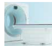
CT(64Ch 3D CT)