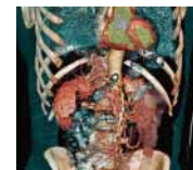
3차원 심장 CT 촬영