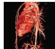
3차원 입체영상 촬영